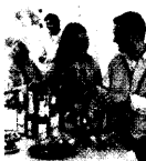
Wer gern Bowlen mixt – siehe Seite 69