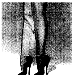
Schuhe, das war früher praktische Bekleidung. Doch in einem Jahrhundert wandelte die Mode dieses Bild. Mehr auf den Seiten 67 bis 71