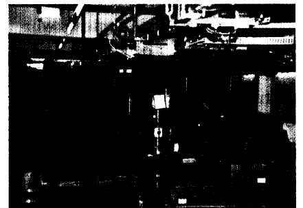
Das Förderband im Logistikzentrum der Centramed