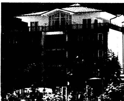
Kempinski Resort Hotel Bel Air, Binz/Rügen (Seite 64)