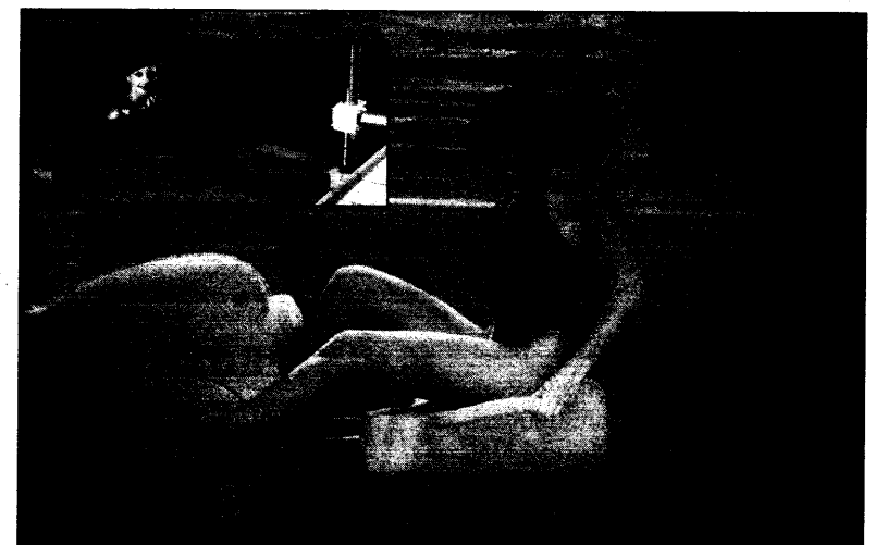
Das Unter-Wasser-Fahrrad erleichtert Patienten mit Kreuzbandriß in der Reha das Strecken der Beine. Die Heilung wird beschleunigt.

Jahrzehnt. Die Einführung des Wohnortprinzips bringe den Kollegen in den neuen Länder 130 Millionen DM oder 10 000 DM je Praxis. Außerdem werde die GOÄ in „schnellen Schritten“ von 86 auf 100 Prozent angehoben. Dies sei nur eine „Entlastung“; viele Probleme könnten nur durch eine große Gesundheitsreform gelöst