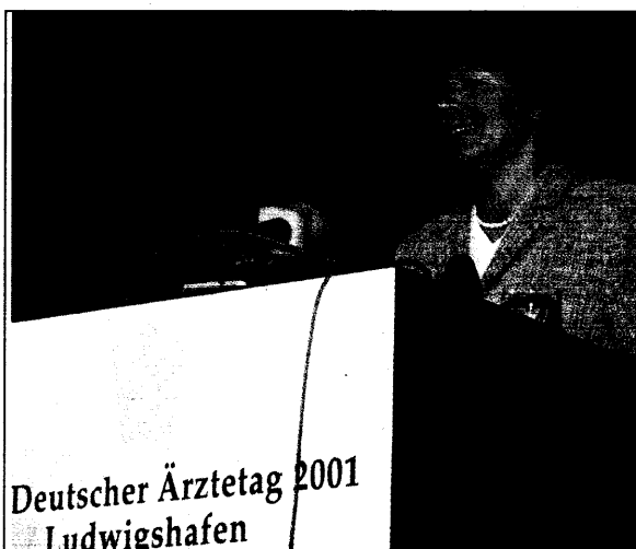
Noch eine Reform – Ulla Schmidt will sich jetzt für eine Novelle der Approbationsordnung einsetzen.