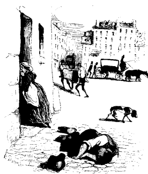
1831 brach in Europa die Cholera aus. Allein in St. Petersburg starben mehr als 4500 Menschen. Bis zum Ende des Jahrhunderts tauchte die Seuche immer wieder in Europa auf. Erst mit der Entdeckung des Erregers durch Robert Koch begann 1883 die wirksame Bekämpfung von Vibrio cholerae . Seite 73