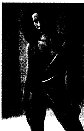
Eines von mehreren farbenkräftigen Beispielen der neuen Bademode, wie sie auf den Seiten 48 und 49 vorgestellt werden