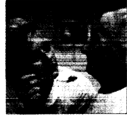
Homecare Therapien und Hilfen für Patienten und ihre Familien