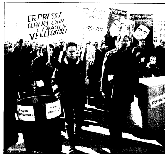
Für eine bessere Versorgung haben Ärzte bei der AOK in Sachsen-Anhalt jetzt die Quittung von AOK...

Aus Sicht der AOK sei dies eine Mißachtung des Sicherstellungsauftrages, so Kasten weiter. Das hingegen will John nicht gelten lassen. Die KV habe die Sicherstellung