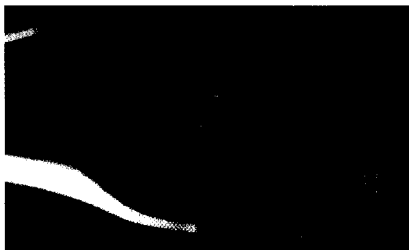
Gehörgangskarzinom im Stadium T4: komplette tumoröse Verlegung des äußeren Gehörgangs

Die definitive Diagnosestellung des primären Gehörgangskarzinoms erfolgt aufgrund der häufigen klinischen Diagnose der rezidivierenden Otitis externa oft verzögert. Der frühzeitigen Diagnosestellung kommt somit eine zentrale Bedeutung hinsichtlich der Prognose zu. Es sollten insbesondere ältere, bislang ohrgesunde Patienten mit neu aufgetretener und therapierefraktärer Otitis externa computertomographisch untersucht und rasch bioptisch abgeklärt werden. Seite 256