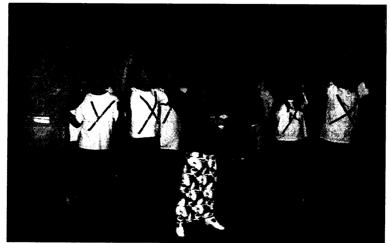
Offensichtlich viel Spaß hatte Gesundheitsministerin Ulla Schmidt bei der Eröffnungsveranstaltung des Weltgesundheitstages in Köln.

gen Westafrika mit 2,4 Prozent, Ostafrika mit 1,2 Prozent und Indien mit 0,3 Prozent. „Basta“ – das sind die Gebiete für die Chemoprophylaxe. Für alle anderen Malariagebiete genüge anders als bisher die Stand-by-Medikation, hat Nothdurft auf dem Kongreß erklärt, der vom TÜV Süddeutschland veranstaltet und von vielen