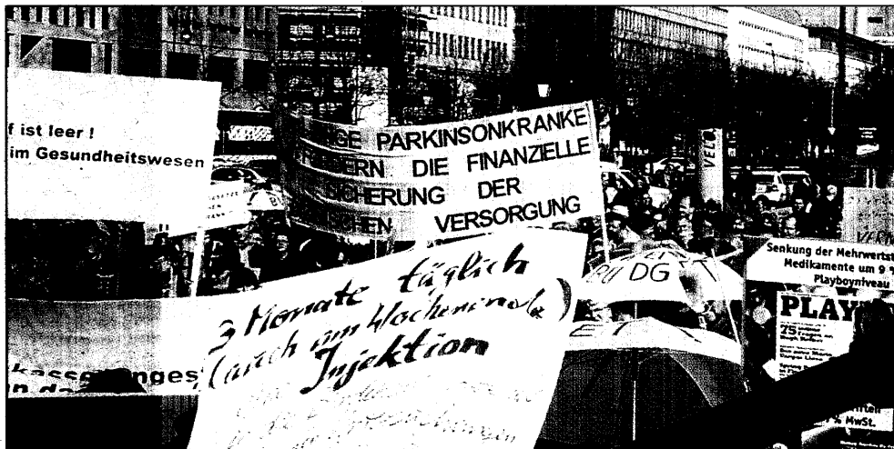
Bei kaltem, aber sonnigem Wetter machten am Mittwochnachmittag Ärzte aus den neuen Bundesländern Demonstrationen.

Die Chancen im Leben sind nicht gleich verteilt, etwa die Chancen von Männern bei Frauen. Einen Beleg dafür, daß Männer, die als Neugeborene ein geringes Geburtsgewicht hatten, dabei Nachteile haben, liefert eine Studie, die morgen das „British Medical Journal“ (322, 2001, 771) veröffentlicht. Ausgewertet wurden die Daten von 3500 Männern, die um 1930 in