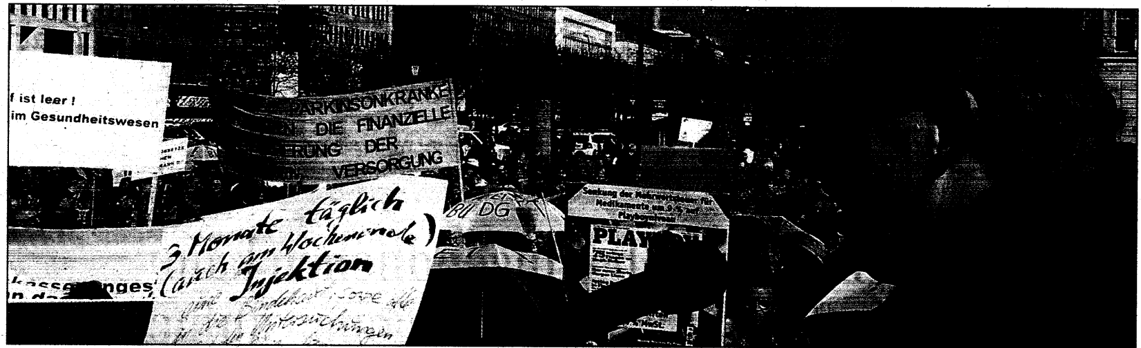
Bei kaltem, aber sonnigem Wetter machten am Mittwochnachmittag Ärzte aus den neuen Bundesländern ihrem Ärger Luft.