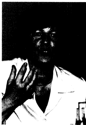
Die Gesundheitsministerin wünscht sich die Zusammenarbeit mit den Apothekern. Während des Interpharm-Kongresses in Hamburg bekräftigte Ulla Schmidt erneut ihre Gesprächsbereitschaft in Sachen Gesundheitsreform. Seite 16