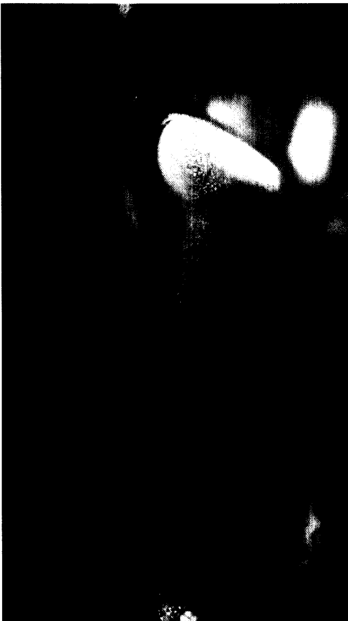
ADOR 2000 Kunststoff oder Keramik? Seite 103