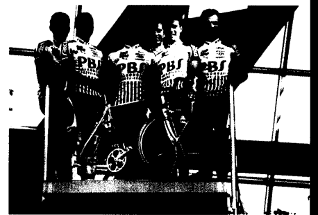
Das „Riff-Team“: Radsportmannschaft stellt sich vor 119