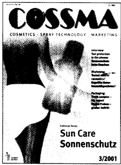
Collage: B:VS Photos: Piz Buin, Delial