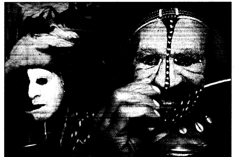
Bunte Welt der Reisen in Berlin

Auch viele Veranstalter bemühen sich um Anerkennung für die Zertifikate. In Schleswig-Holstein hatten sich in den ersten zwei Monaten nach Inkrafttreten der