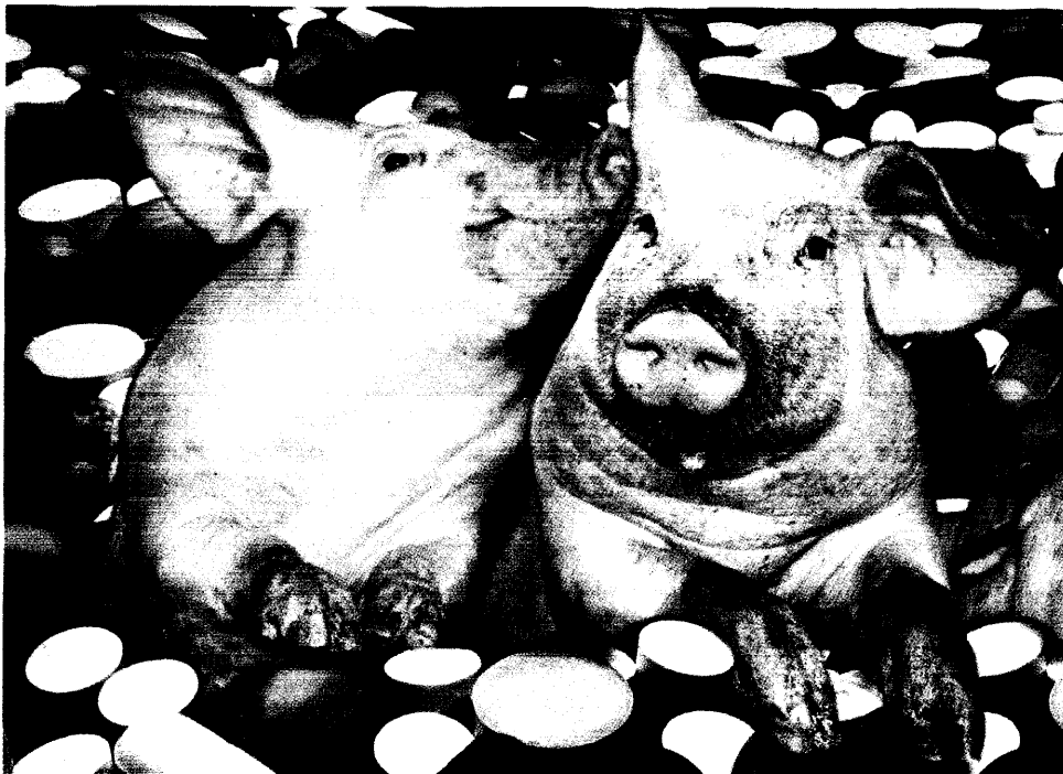
Tiermast mit Antibiotika: Wer oder was wird da resistent?

Wertpapiere dieser Art werden erst am Ende der Laufzeit verzinst – da sieht der Fiskus alt aus ▶ 19