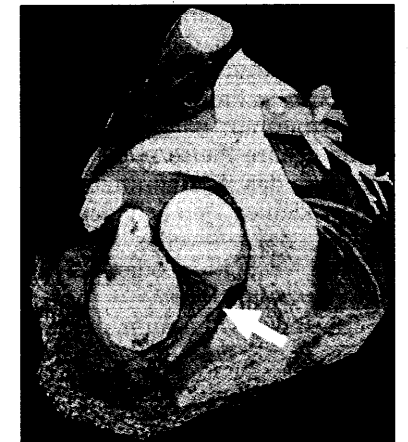
Abgang der rechten Koronararterie (Pfeil) mit UCT dargestellt.