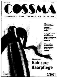
Collage: B:VS