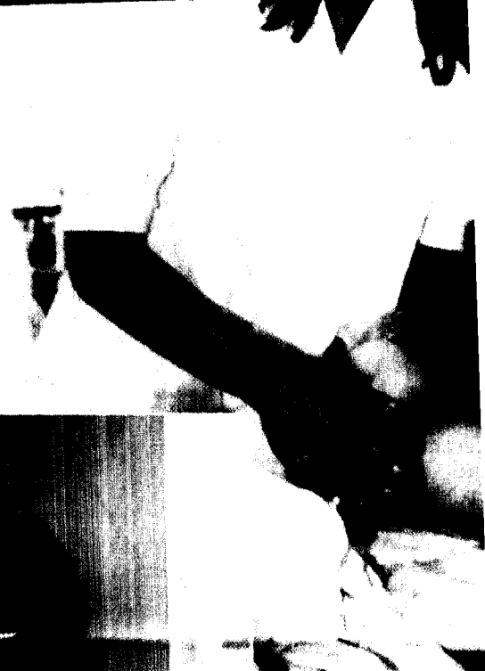
Noch einmal im Schw der Kinderstation des in Hamburg-Volksdor