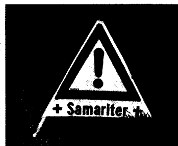
Seite 28 Bundeswettbewerb in Saarbrücken