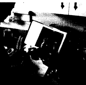
Im Trend: Bewusste »Vitalstoffzufuhr«