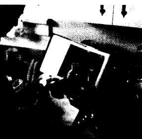
Im Trend: Bewusste »Vitalstoffzufuhr«