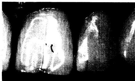
Estetic dentistry - Chairsiterestaurations vom feinsten (Seite 26)