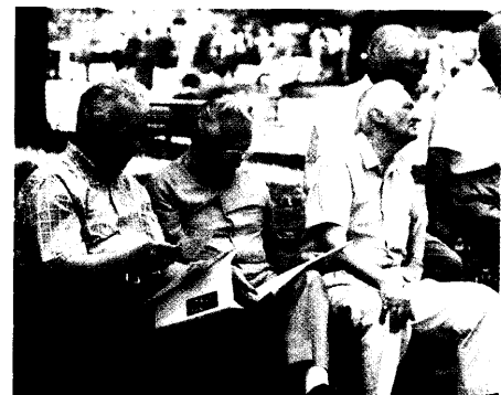
Aging Male Die Testosteron-Substitution kann über eine Hormonkrise helfen. Experten warnen jedoch vor der prophylaktischen Gabe.