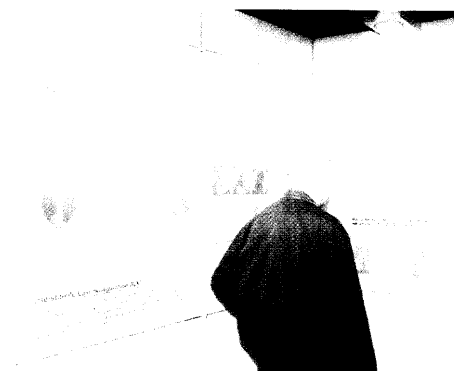
1. Bonner Männertag Interessierte Herren informieren sich über die Lasertherapie der gutartigen Prostata-Vergrößerung.