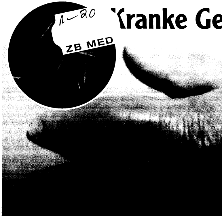
Harnsäure-Kristalle in der Synovia (links oben) – und ihre Folgen: ein Fall von Gicht-Arthritis.

Ärzte, die Labor-Analysen nicht korrekt interpretieren, können auf Schadenersatz verklagt werden ▶ 20