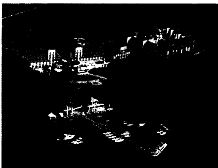
Kempinski Hotel & Resort Sporting Club Berlin - Bad Saarow (Seite 68)