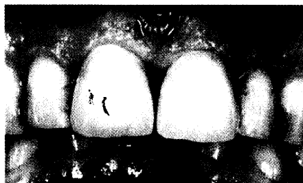
Schönheitssalon Zahnarzt: Neue Zähne in vier Stunden! (Seite 24)