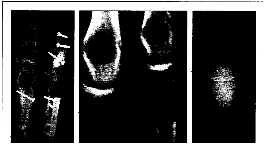
Trümmerfraktur (links) und Enchondrom (Mitte) der Fingerknochen: beides sind Defekte, die mit Granulat aus Trikalziumphosphat aufgefüllt werden können. Das Granulat ist auf dem linken und rechten Röntgenbild als körniges Füllmaterial zu erkennen.