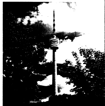
interbad 2000: Infos zur Kongress-Stadt Stuttgart 499

Titelseite: Fernsehturm Stuttgart; Foto: Stuttgart-Marketing Mineralbad Leuze; Foto: Stuttgart-Marketing