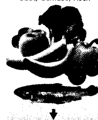
Obst, Gemüse, Fisch

Neu in der Ausbildungs- und Prüfungsordnung für PTA ist die Einführung einer vierwöchigen Famulatur, dem so genannten Schnupperpraktikum. Bisher gab es zum Inhalt der Famulatur keine Hilfestellung. Der BVpta und der BVA haben nun gemeinsam einen Leitfaden erarbeitet, an dem sich jede öffentliche Apotheke orientieren kann. Tipp: Ausschneiden und sichtbar aufhängen!