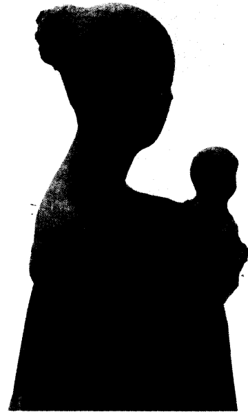
H. APEL: PLASTIK „MUTTER UND KIND“