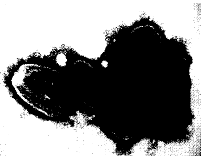
Das Marburg-Virus lagert in einem Hochsicherheitstrakt des Marburger Instituts für Virologie. Forscher sind dem Virus auf der Spur. Ein Tagungsbericht. Seite 77

Anmeldung zum Ski-Opening · 129 · Arzneistoff-Dialog 131 · Festbeträge · 137 · Neueinführungen · 151 · Änderungen · 155 · Dokumentation · 157 · APG-Rückruf · 159