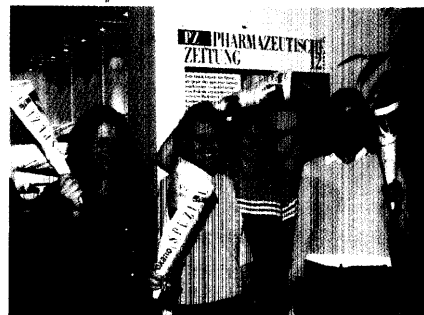
Expopharm, die internationale pharmazeutische Fachmesse, war Forum für über 450 Aussteller. Mit vier tagesaktuellen Ausgaben der PZ Spezial informierte die PZ-Redaktion ausführlich. Seite 30