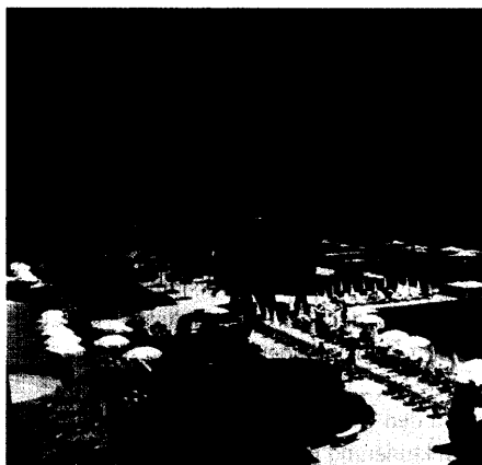
Çırağan Palace Hotel Kempinski Istanbul (Seite 87)