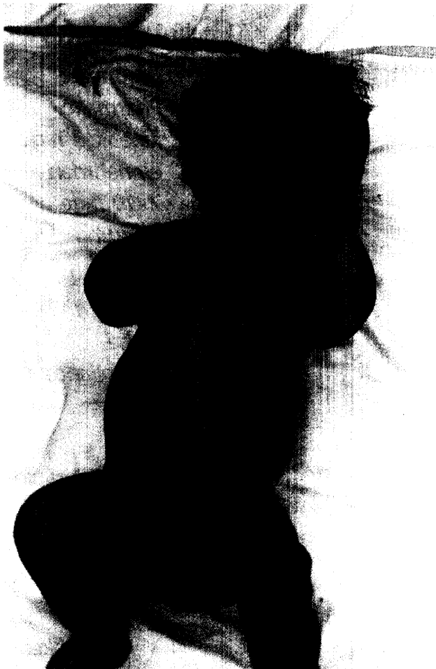
Abb.: Welche Diagnose wird gestellt?

Differentialdiagnostik und Therapie rezidivierender Kopfschmerzen