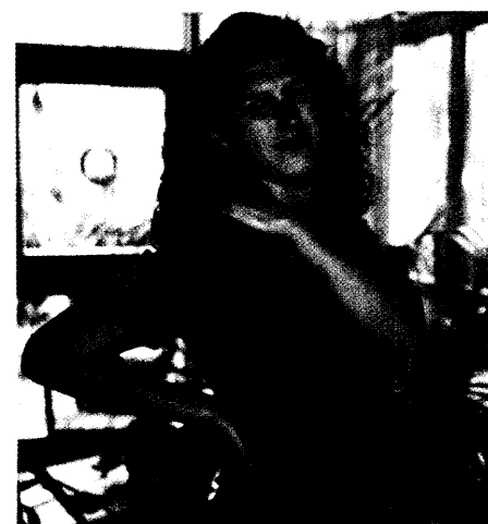
Die Psychosomatik differenziert nicht mehr strikt: Ist die Lumbago-Ischialgie psychogen oder somatogen? Sondern: Wie hoch sind die jeweiligen Anteile? Die neue Nosologie eröffnet auch neue Therapiehorizonte. 14