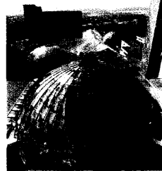
Die Rhön-Klinikum AG in Bad Neustadt an der Saale.

... ist das Ziel von Benchmarking-Projekten. Das Krankenhaus-München-Schwabing nimmt an einem solchen, vom BMG geförderten überregionalen Projekt kommunaler Krankenhäuser teil. Es sollen DRGs ermittelt werden, die sich zum Benchmarking eignen und einen Vergleich, etwa hinsichtlich Verweildauer, Altersverteilung und Kostenstruktur, ermöglichen. „Vergleichen mit AP-DRG“ 772