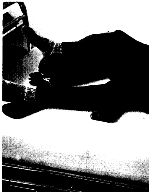
Klein-Tarolli/Müller/Unterstützung der Bewegung: In der Kinästhetik und nach dem Bobath-Konzept ist Bewegung ein zentrales Element der Lagerung von Patienten. Der Bericht ab Seite 784 zeigt die Anwen- dung im Bereich der Dekubitusprophylaxe.