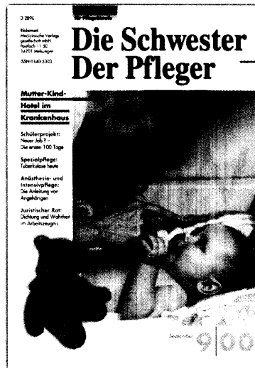
Titelbild: Das Mutter-Kind-Hotel ermöglicht Wöchnerinnen und ihren Familien, mit den Kleinen Tag und Nacht zusammen zu sein. Die Eltern übernehmen die Versorgung des Kindes und können dabei jederzeit Fachpersonal um Unterstützung bitten. Seite 756