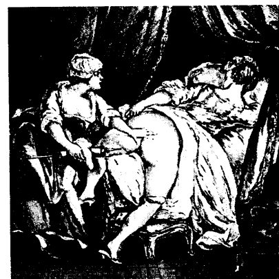
Schon die Ägypter kannten Klistiere. Bis zum 19. Jahrhundert wurden Einläufe mit den verschiedensten Inhaltsstoffen als Mittel gegen alle erdenklichen Gebrechen eingesetzt. Seite 56