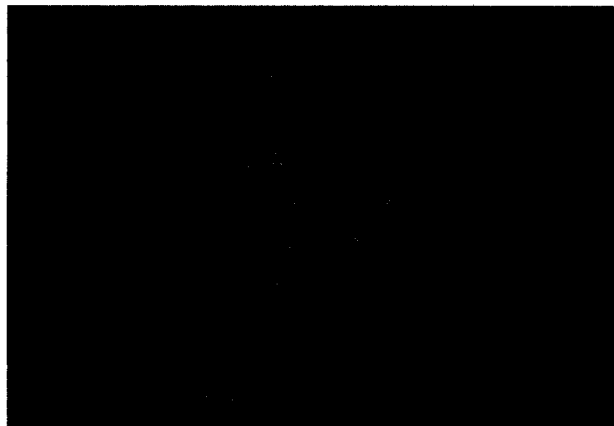
Das Kaiser Wilhelm Thermalbad in Bad Homburg

Kanada, Frankreich, Italien, Süd Afrika und Argentinien – wir hoffen, keiner wurde vergessen – bereits das Ambiente unseres Tagungsortes vorgestellt und sponta-