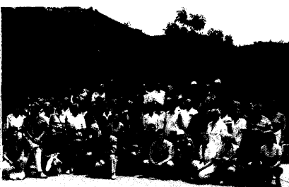
Neben Akupunktur, chinesischer Massage und Phytotherapie stand auch die chinesische Mauer auf dem Programm der PZ-Leserreise nach China. Seite 58

Informationen und Anmeldung zum FIP-Kongress 2000 in Wien auf den Seiten 36 und 131.