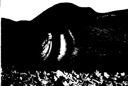
Robben sind ein Reservoir für Grippeviren, Caspase-8 ist der Todesbote einer geschädigten Zelle, Menschen mit Sprachstörungen erkennen eine Lüge besser als andere. Neues aus der Wissenschaft lesen Sie ab Seite 62.