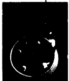
Sinnliches Essen; Seite 58