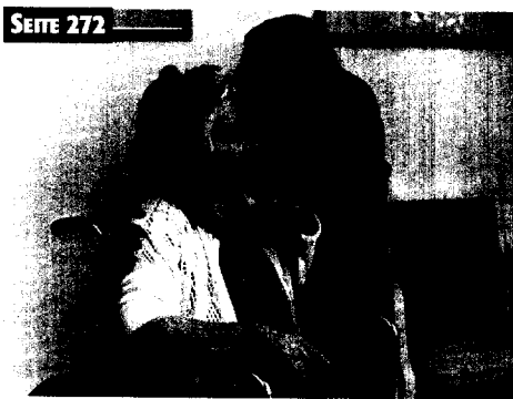
Belastungen in der stationären Altenpflege haben sich für Pflegenden erhöht.