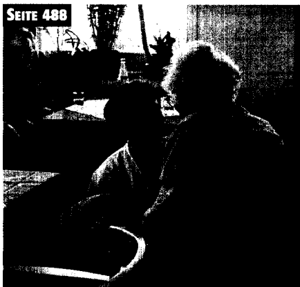
Pflegequalität orientiert sich am individuellen Pflegebedarf