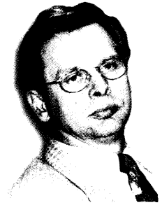
Richter-Reichhelm stellt sich ganz in den Dienst der KBV. 9