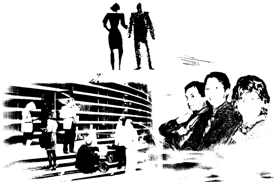
Impressionen vom Kongreß

Alzheimer Gesellschaft statt. „Brücken in die Zukunft“ ist eine Aufforderung, Verbindungen zwischen allen herzustellen, die mit der Alzheimer-Krankheit zu tun haben, aber oft wenig voneinander wissen: die Kranken und ihre Familien, die beruflich Pflegenden und die Mediziner, Sozialarbeiter, Grundlagenforscher und viele andere. Zu verstehen und zu vermitteln, was Alzheimer-Kranke und ihre Familien wünschen und brauchen, ist eine der wesentlichen Aufgaben der Alzheimer Gesellschaften in allen Ländern.