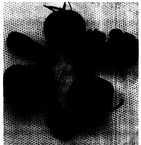
Die rot-grüne Diät